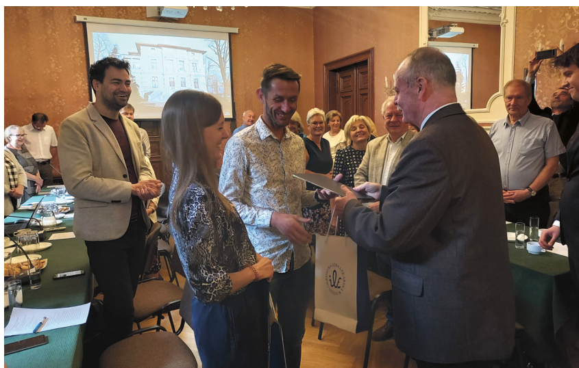
Podczas posiedzeń ORL wielokrotnie spotykaliśmy się z lekarzami, którzy wspaniale reprezentowali nasze środowisko w różnych dziedzinach – m.in. biegaczami

Serdecznie dziękuję za miniony rok. Ten, który już się zaczął, pokazuje, że wcale nie będziemy mieli mniej pracy, wręcz przeciwnie. Koleżankom i Kolegom – aktywnym samorządowcom, a także sobie życzę, by była to praca pełna satysfakcji. ●