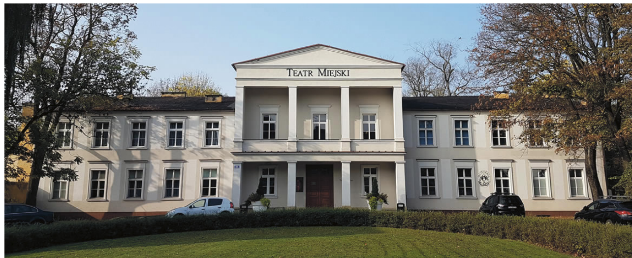
Kabaret OIL występował w Teatrze Miejskim w Lesznie