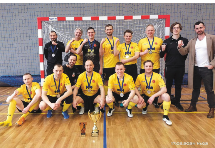
2 miejsce OIL Gdańsk