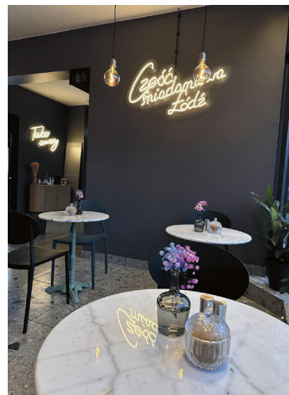
Caffe Przy Ulicy

Lokale specjalizujące się w śniadaniach nie miały szczęścia na Widzewie, dość krótko działało Creme de la Creme i inne miejsca oferujące pierwszy posiłek dnia. Ale teraz w okolicy ryneczku Batorego wkroczyła królowa łódzkich śniadaniowni, lokalna sieć Caffe Przy Ulicy. I jestem w pełni przekonana, że poranna klątwa rzucona na Widzew właśnie została zdjęta. Fenomen Caffe opiera się na kilku elementach: mamy tu bardzo zróżnicowane, ale dopracowane menu, pełne naprawdę smacznych dań, szybkość obsługi, co o poranku jest kluczowe, przyjazne wnętrza i ceny – choć te oczywiście, jak wszędzie, w ostatnim czasie poszybowały w górę. Jednak nadal nie jest tak, jak w jednej z restauracji przy Piotrkowskiej, gdzie trzeba zapłacić blisko 50 zł za „śniadaniowego burgera”.