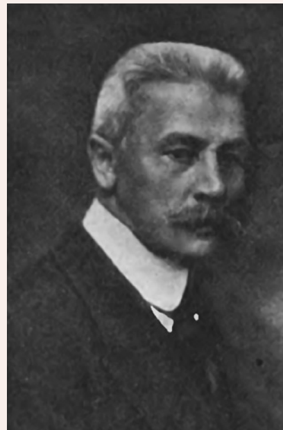
portrety niepospolitych medyków

Tajemnicza aura otacza też lata służby medyka na froncie. Nie chce na ten temat mówić. Można się domyślać, że ówczesny sposób prowadzenia wojny i walk przynosi tragiczne żniwo i medyk w najlepszym przypadku może szybko amputować kończyny uszkodzone kulą armatnią lub innym