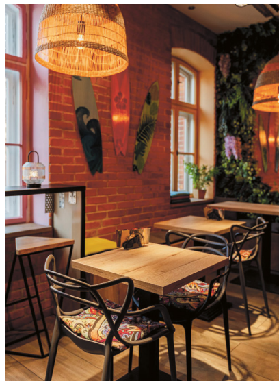
Maui Hawaiian Breakfast

A gdy już jesteśmy w tej okolicy, to trudno nie wspomnieć o miejscu nietypowym, bo nawiązującym do klimatu Hawajów! Tropiki w samym sercu dawnego robotniczego osiedla? Takie rzeczy tylko na Księżym Młynie! Przyznam, że ja tam jeszcze nie dotarłam, więc wesprę się cytatem z blogu moich serdecznych koleżanek z Jemy w Łodzi: „Śniadania podawane są tu od 8.00 rano. Dzień możemy