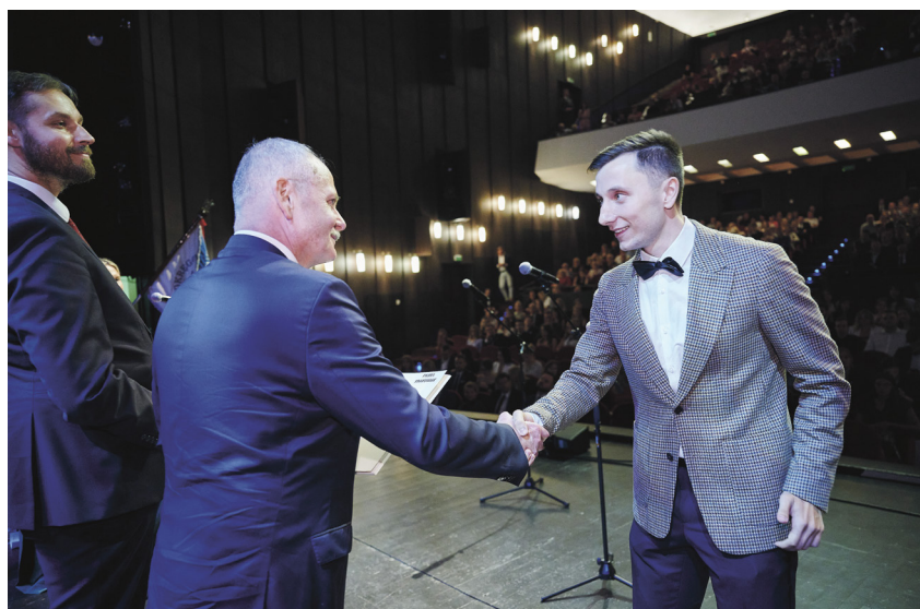
Uroczyste wręczenie praw wykonywania zawodu to już tradycja w łódzkiej OIL. W minionym roku z młodymi lekarzami spotkaliśmy się w gmachu Teatru Wielkiego.

Podjęliśmy także akcję związaną z przejmowaniem kompetencji lekarzy przez przedstawicieli innych zawodów medycznych. Przedmiotem naszych wystąpień zarówno formalnych, jak i medialnych, było tworzenie wydziałów lekarskich w placówkach, które nie miały akredytacji Państwowej Komisji Akredytacyjnej i nie spełniały