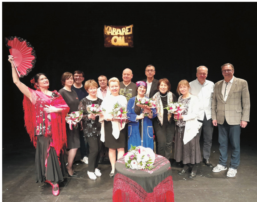
Na gościnny występ Kabaret OIL pojechał w pełnym składzie!