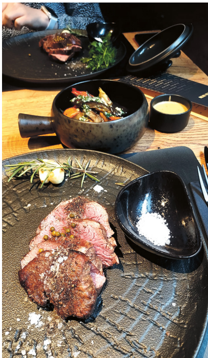
Ogień i Sól

W karcie królują steki, w tym te najbardziej ekskluzywne, z wołowiny Wagyu. Są też cztery rodzaje tatarów, zupy, kilka dań głównych i trzy desery. Karta krótka, acz treściwa. I co ważne – nie ma menu dziecięcego, więc