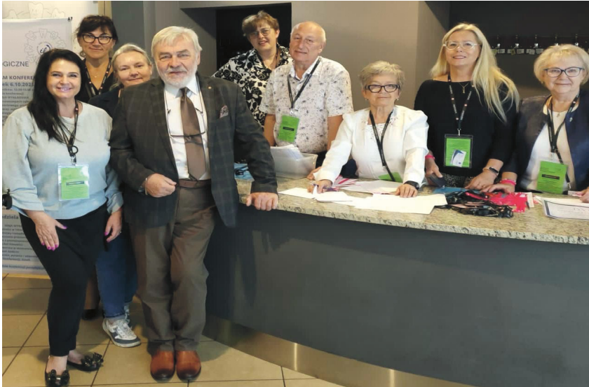
Flagowym wydarzeniem Komisji Stomatologicznej są Łódzkie Spotkania Stomatologiczne