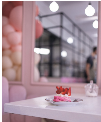
Sugar by Blonde

Kolejna różowa kawiarenka (o pierwszej pisałam w poprzednim numerze), tym razem otwarta przez właścicielkę pracowni cukierniczej, mieszczącej się obok – w loftach. Teraz spacerując Kocim Szlakiem, możemy zajrzeć do Sugar by Blonde na dopracowane w największych szczegółach monoporcje, pyszne ciasta i bezy. Młoda łodzianka tworzy cukiernicze dzieła sztuki. Ważne – lokal czynny jest tylko od piątku do niedzieli.