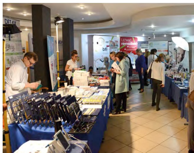
Podczas ŁSS można nie tylko zapoznać się z ofertą producentów, ale też porozmawiać o nowinkach w branży