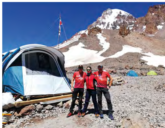
Od 2016 r., co sezon polscy lekarze realizują dyżur ratowniczy u podnóża szczytu Kazbek.