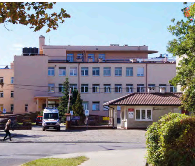
Szpital w Łowiczu najbardziej potrzebuje internistów i pediatrów. W rozwiązaniu problemu kadrowego mają pomóc stypendia dla studentów.

„Oferty pracy z benefitami” kierowane są jednak nie tylko do młodych. Na podobny krok zdecydował się Szpital Powiatowy im. T. Chałubińskiego w Zakopanem, który poszukiwał lekarza do pracy w Szpitalnym Oddziale Ratunkowym. Oprócz umowy cywilnoprawnej, czyli popularnego