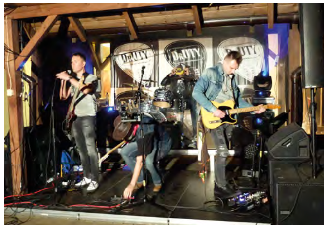
Zespół Druty wystąpił podczas spotkania przy grillu

Następnie podziękowano sponsorom (lista poniżej) i wręczono przedstawicielom firm okolicznościowe puchary.