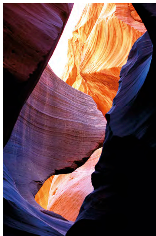
– III miejsce