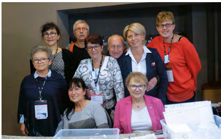
Trzon Komisji Stomatologicznej oczekuje na uczestników