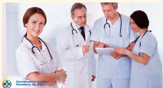
Zduńskowski Szpital Powiatowy Sp. z o.o.