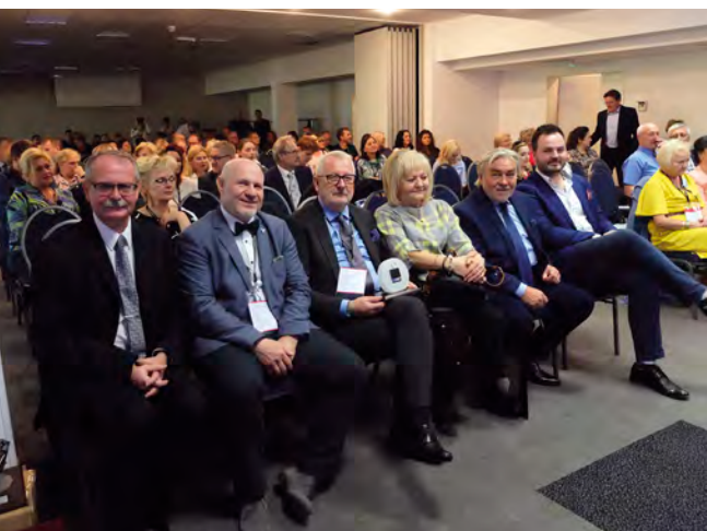
Władze Naczelnej i Okręgowej Izby Lekarskiej