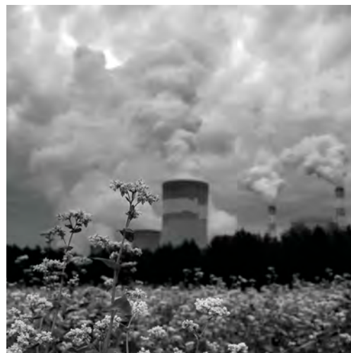
Fot. Jerzy Ratajski – I miejsce