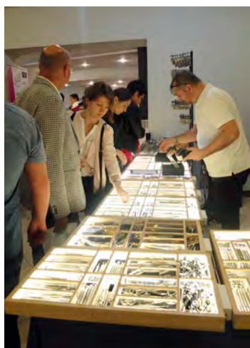
Na stoiskach można było zakupić m.in. kleszcze lub dźwignie